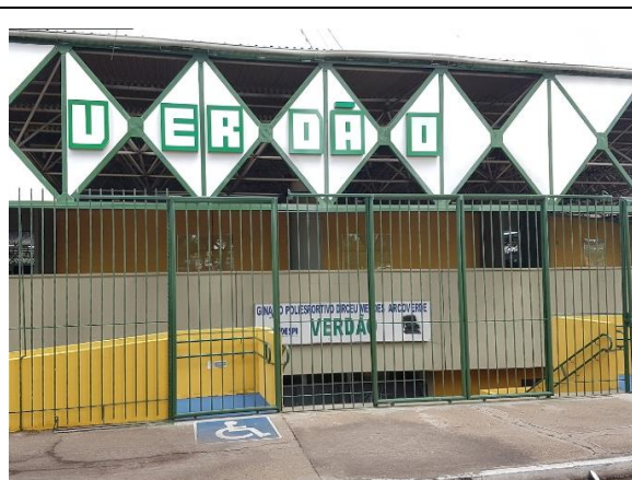
Figura 02: Vista frontal, entrada principal com rampa de acessibilidade.

A obra de modernização e adequação do Ginásio do Governo do Estado seguiu uma nova proposta conceitual, com o melhor aproveitamento do equipamento, implantação de espaços modernos e de multiuso, tendo como foco principal as práticas poliesportivas e o conforto dos usuários, a segurança do espaço e a flexibilidade das instalações.