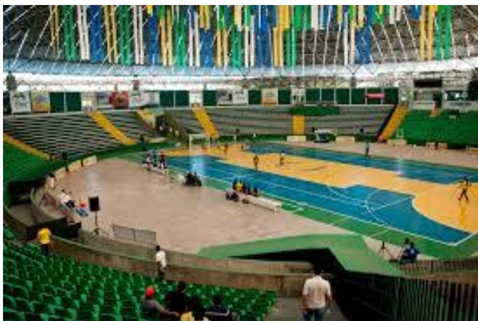
Figura 3: Imagem do Ginásio Verdão após a Reforma.

De toda a forma, o Ginásio possui ampla área para a realização de eventos esportivos, de lazer, culturais, empresarias e educacionais, podendo ser explorada comercialmente, desde que a conservação do patrimônio público seja assegurada pela concessionária. Outra característica apontada é a disponibilidade de áreas para exploração através de aluguel.