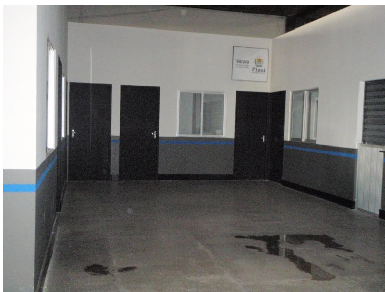
Figura 23: Pintura das áreas institucionais