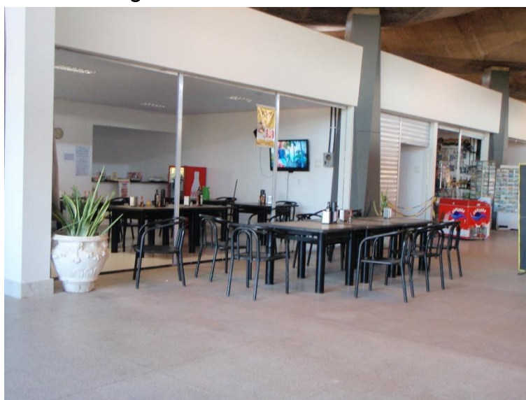
Figura 19: Restaurantes concluídos