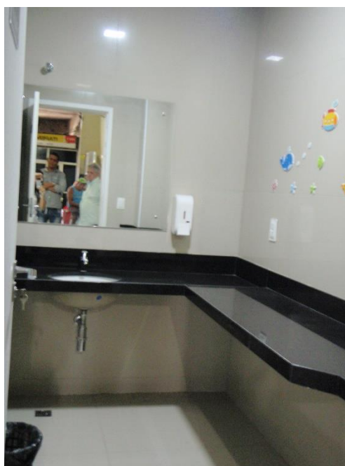
Figura 13: Fraldário do Térreo