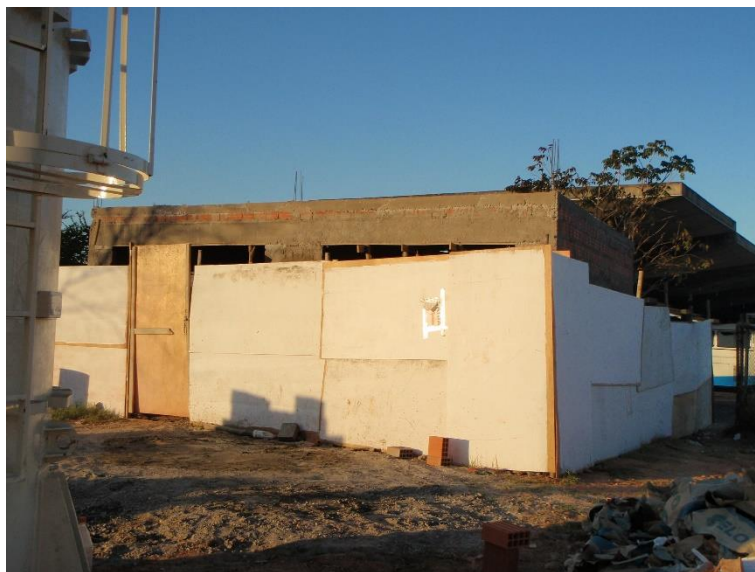
Figura 04: Construção dos sanitários