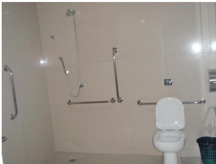
Figura 12: Banheiro PNE do Térreo