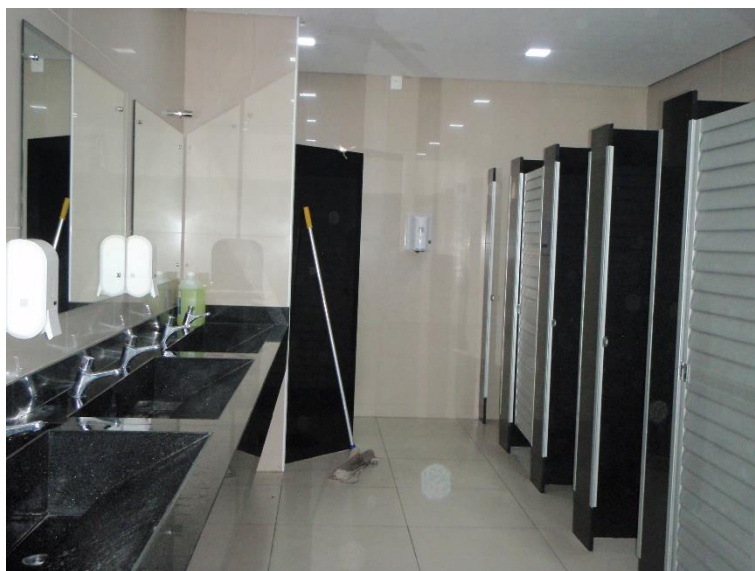
Figura 11: Banheiro feminino do Térreo