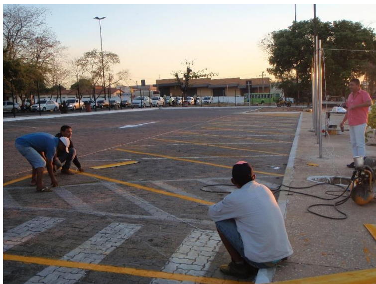
Figura 15: Pintura das sinalizações horizontais das Vias