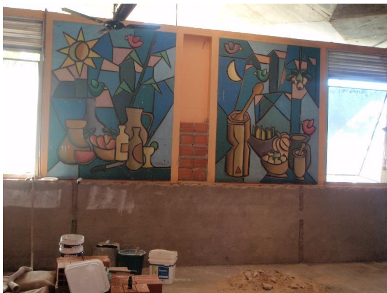
Figura 16: Lanchonetes em construção