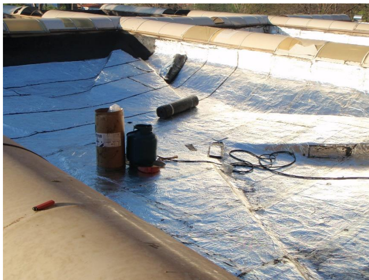
Figura 20: Impermeabilização das pétalas