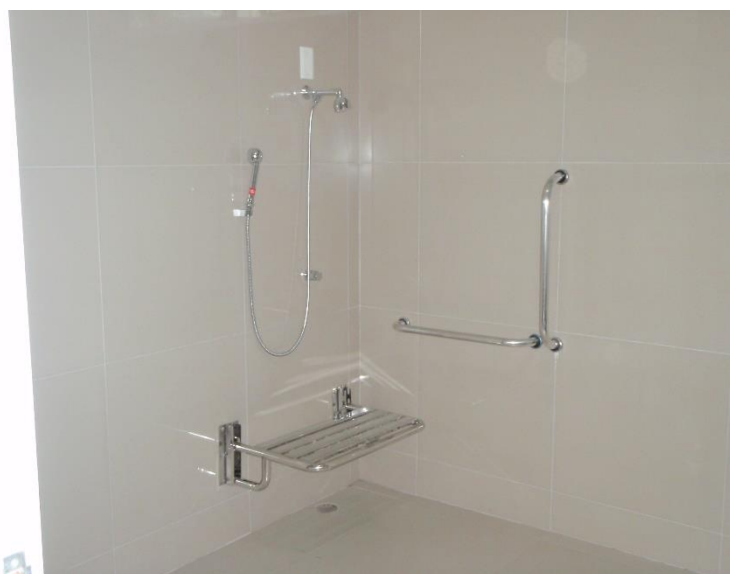
Figura 09: Banheiro PNE da Praça de Alimentação