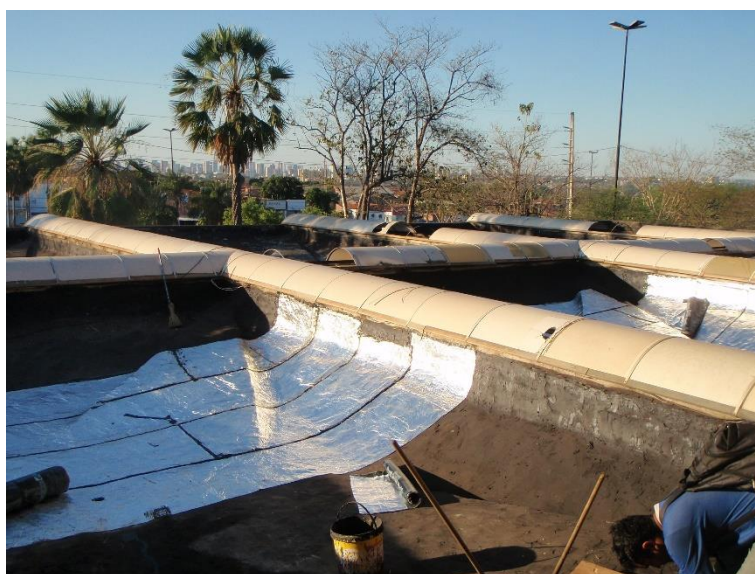
Figura 21: Impermeabilização das pétalas