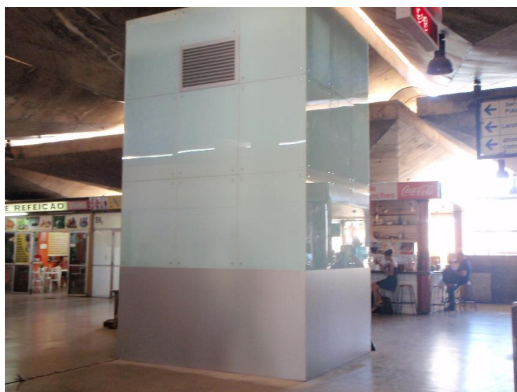
Figura 03: Painéis de revestimento do Elevador – 1º andar