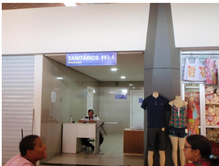
Figura 06: Entrada e setor de cobrança dos Sanitários da Praça de Alimentação