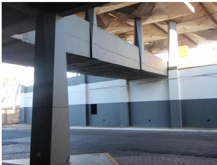
Figura 22: Pintura das áreas externas