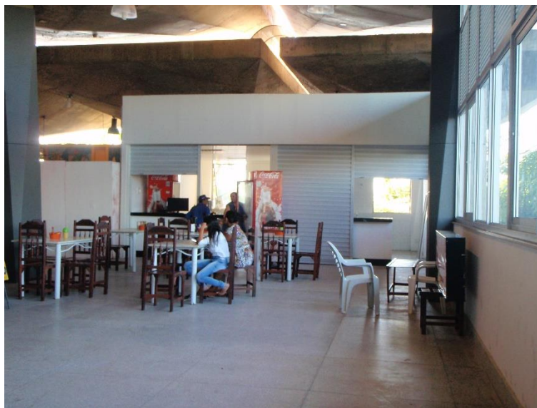
Figura 18: Restaurantes concluídas