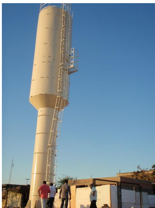
Figura 05: Caixa d'água