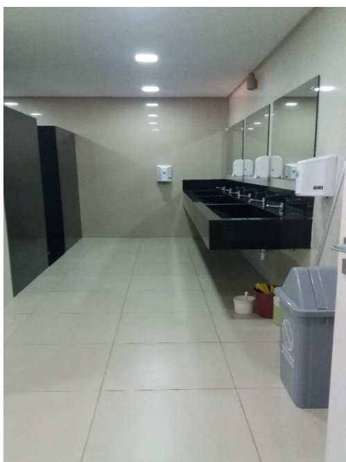
Figura 07: Banheiro feminino da Praça de Alimentação