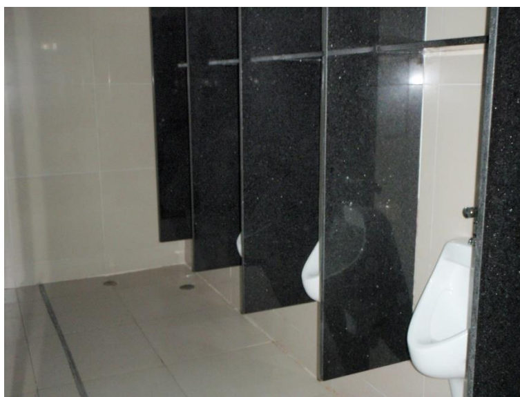
Figura 08: Banheiro masculino da Praça de Alimentação