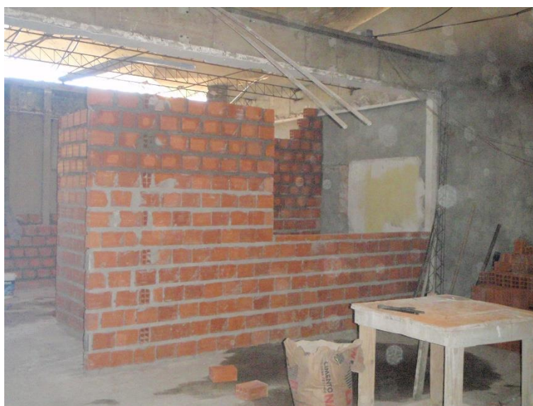
Figura 17: Lanchonetes em construção