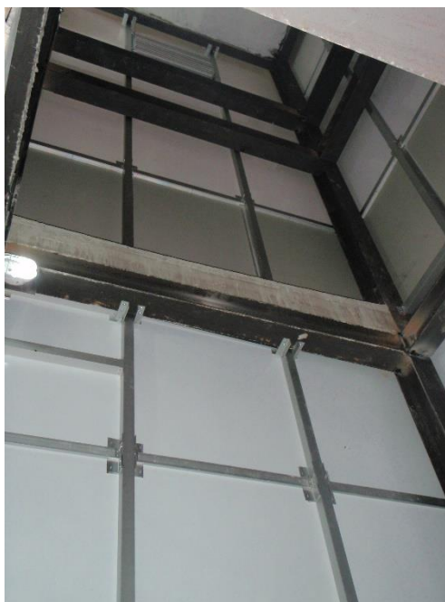
Figura 01: Fosso do Elevador